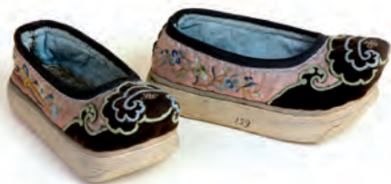
Kína, 19. század vége Néprajzi Múzeum; ltsz.: 68.108.79. 69.108.110