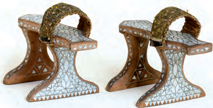
Fapapucs, kabkab, női Földközi-tenger vidéke, 19. század Néprajzi Múzeum; ltsz.: 69.108.13.1-2