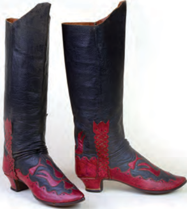
Csizma, női, magyar Csököly, Magyarország, 19. század vége Néprajzi Múzeum; ltsz.: 15568 a–b

A fekete szattyánbőr ( kordován ) csizma fából faragott sarka piros bőrral bevont. Tulipánminta bőrrelátja a vidéken viselt ködmönök, börmellények díszítményeivel mutat rokonságot.