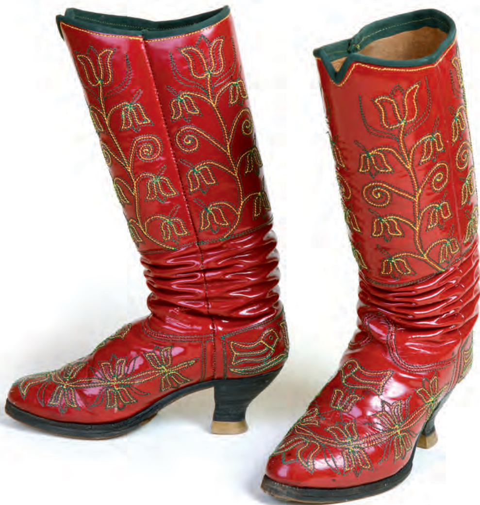
Csizma, női, magyar Inaktelke (Inucu, Románia), 1989 Magántulajdon