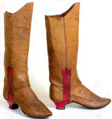
Csizma, női, magyar Kásád, Magyarország, 19. század vége Néprajzi Múzeum; ltsz.: 15588 a–b

Egy Pest vármegyei paraszt és egy szolgáló Bikkessy Heinbucher József színezett rézmetszete, 1816 In: Bikkessy Heinbucher József: A Magyar és Horváth Országí Leg nevezetesebb Nemzeti Öltözetek Hazai Gyűjteménye. Béts, 1816