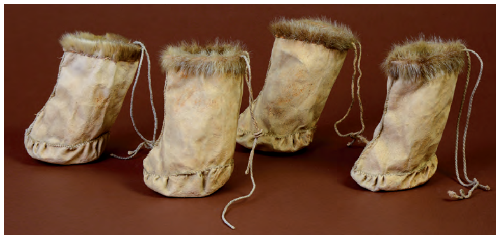
Kutyacsizma fókabőrből, inuit Grönland, Dánia, 19. század második fele Néprajzi Múzeum; ltsz.: 32148.1-2