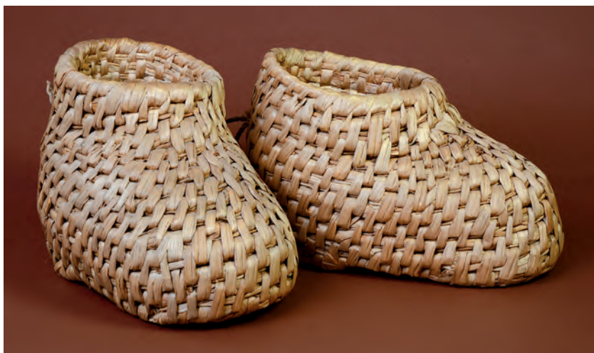
Nádvágó csizma, magyar Tyukod, Magyarország, 20. század közepe Néprajzi Múzeum; ltsz.: 64.87.30