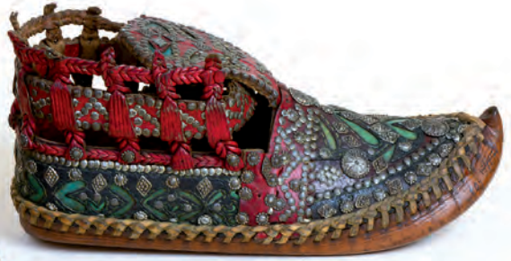
Bocskor, férfi, bosnyák Bosznia (ma: Bosznia-Hercegovina), 20. század első fele Néprajzi Múzeum; ltsz.: 130709