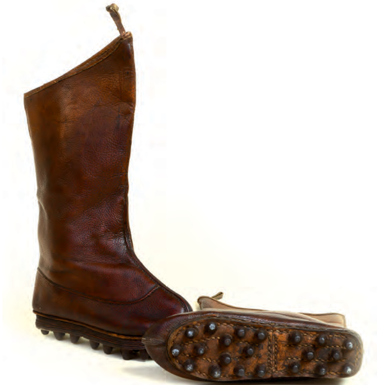
Csizma, mongol Mongólia, 20. század eleje Néprajzi Múzeum; ltsz.: 53.123.1