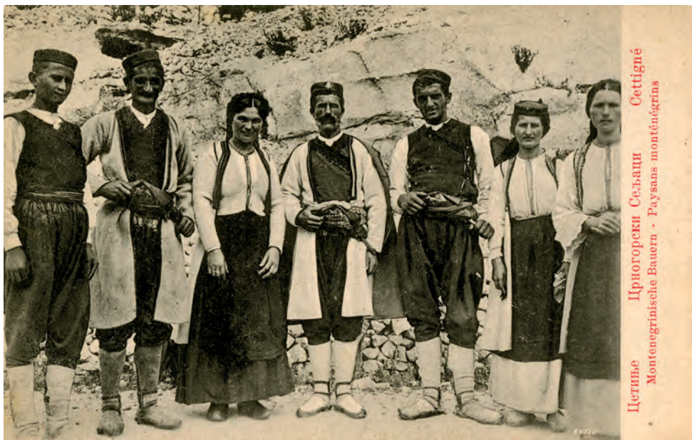
Montenegrói parasztlak. 1910-es évek

A kiállítás címe három különböző típusú lábbelire utal, amelyek egymástól távoli földrajzi helyeket, korszakokat és kultúrákat képviselnek, technikai jellemzőik és funkciójuk is eltérő. Ugyanakkor a példaként kiemelt első három tárgy a múzeumi gyűjtés jellegére és a tárgykutatás különböző lehetőségeire is rámutat. A gyűjteményben őrzött tárgyak egy csoportját különlegességük, esztétikai értékük miatt távoli, egykor nehezen megközelíthető régiókban gyűjtötte az érdeklődő utazó. Más tárgyak a muzeológus terepmunkája során, személyes kapcsolatok révén kerültek a múzeumba. A különböző gyűjtési helyzetekből adódóan a tárgyakról különböző ismeretanyaggal rendelkezünk, így a kutatás kiindulópontja és a tárgy megközelítésének módja is nagyon eltérő lehet. A lábbelik megismerésének folyamata, a kutatás maga a muzeológus „kalandozása” távoli és közeli kultúrákban.