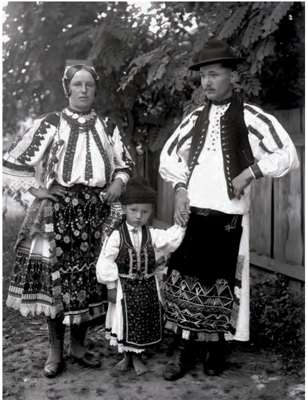
Bosnyák család ünneplőben Szalánta, Magyarország Gönyey Sándor felvétele, 1923 fekete-fehér üvegnegatív, 10×15 cm Néprajzi Múzeum; F 50892