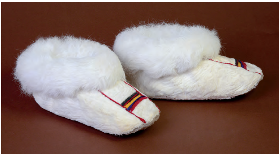
Rénszarvasprém mamusz, női, nyenyec Urál vidéke, Északnyugat-Szibéria, Oroszország, 2006 Néprajzi Múzeum; ltsz.: 2007.4.1.1–2

Bizonyos környezettípusok kiemelt szerepet kapnak az életünkben. Ilyen érzelmileg kiemelt jelentőségű tér az „otthon” is, mely egyszerre jelenti magát a lakóhelyet és a lakásban való viselkedési normákat is. Az otthoni közegben, a privát szférában szabadabban, ellazultabban viselkednek az emberek, lekerülnek róluk az utcai öltözetek, s felváltják őket az otthoni ruhadarabok, lábbelik. Az otthoni szféra szabályozása nemcsak a viselkedési normákban, de az öltözködés tekintetében is nagyon változó. Vannak népek, ahol az otthoni térben kötelező a mezítlábasság, van, ahol bőrcapát, van, ahol mamuszt, papucsot vagy zoknit illik viselni.