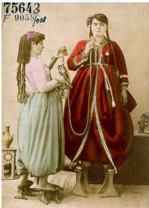
Damaszkus, Szíria, 1880-1896 fekete-fehér pozitív, 10,5x15 cm