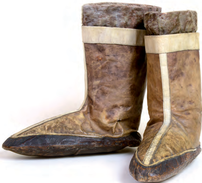
Fókabőr csizma, inuit Grönland, Dánia, 19. század második fele Néprajzi Múzeum; ltsz.: 2013.19.37.1-2